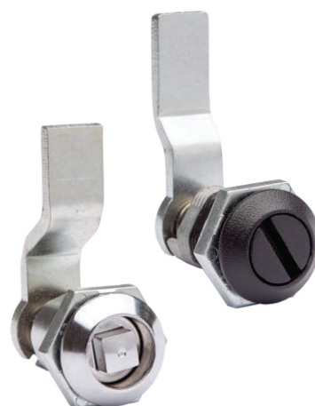
Furação para montagem