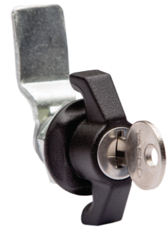
Furação para montagem