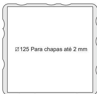
FURAÇÃO PARA MONTAGEM

Para exaustão acrescentar E no final do código. Ex: TF22001E