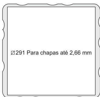
FURAÇÃO PARA MONTAGEM

Para exaustão acrescentar E no final do código. Ex: TF67001 E