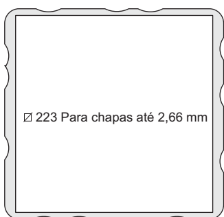
FURAÇÃO PARA MONTAGEM

Para exaustão acrescentar E no final do código. Ex: TF43001 E